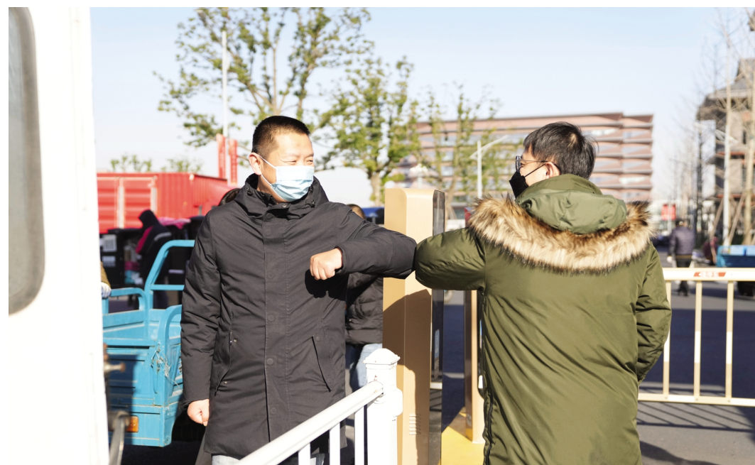
12月16日下午5点,学校接属地疾控通知后,启动应急预案,第一时间实行校园封控管理,并组织全体师生员工核酸检测。社会各界爱心人士也通过各种方式关注我校防疫动态。图为18日上午,一名社会爱心人士(右一)向我校捐赠100箱矿泉水,学校后勤服务公司负责人(左一)接受捐赠。张谦益 摄

局。要进一步完善人才工作的考核机制,加大人才投入的强度力度,营造“尊贤重士”的校园氛围。四要奋力做好人才工作,赋能学校跨越发展。要统筹推进构筑人才发展主平台,实施人才引并举工程,持续优化人才生态,着力打造尖峰学科和团队,形成人才竞争核心优势;要加快建立以创新价值、能力、贡献为导向的科技人才评价体系,激发人才活力,使学校成为海内外人才向往之地、事业发展之地和价值实现之地。