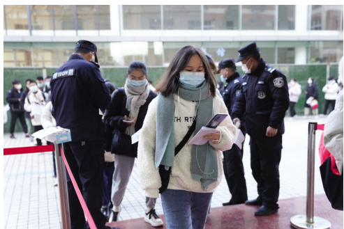
大学英语四六级考试候考