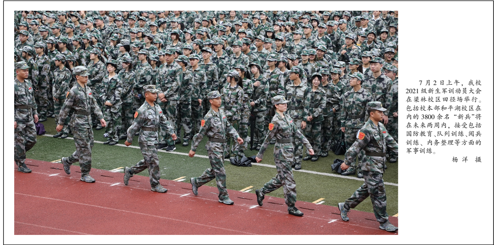
7月2日上午,我校2021级新生军训动员大会在崇林校区田径场举行。包括校本部和平湖校区在内的3800余名“新兵”将在未来两周内,接受包括国防教育、队列训练、阅兵训练、内务整理等方面的军事训练。