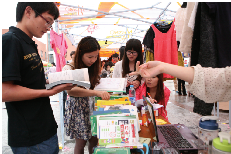
“跳蚤市场”火爆开市

6月1日,由校学生会组织开办的“跳蚤市场”在越秀校区美食城广场火爆开市,40多个摊位陈列了同学们的旧书籍、旧衣服、旧包等物品以及DIY手制品,吸引了大批学子前来选购。