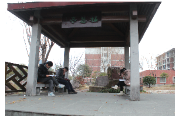
学子在寒风中苦读