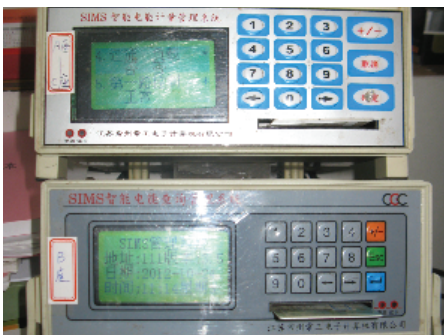
宿舍管理中心引进的“SIMS智能电能计量管理系统”

2003年,宿舍管理中心率先引进常工电子“SIMS智能电能计量管理系统”,使我校成为在