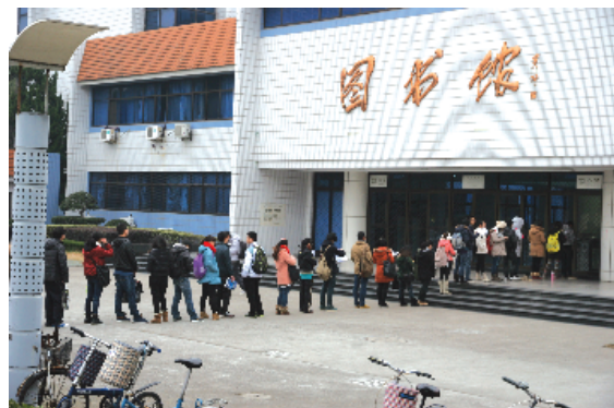
图书馆还没开门,学子们已经在门前排起了长队