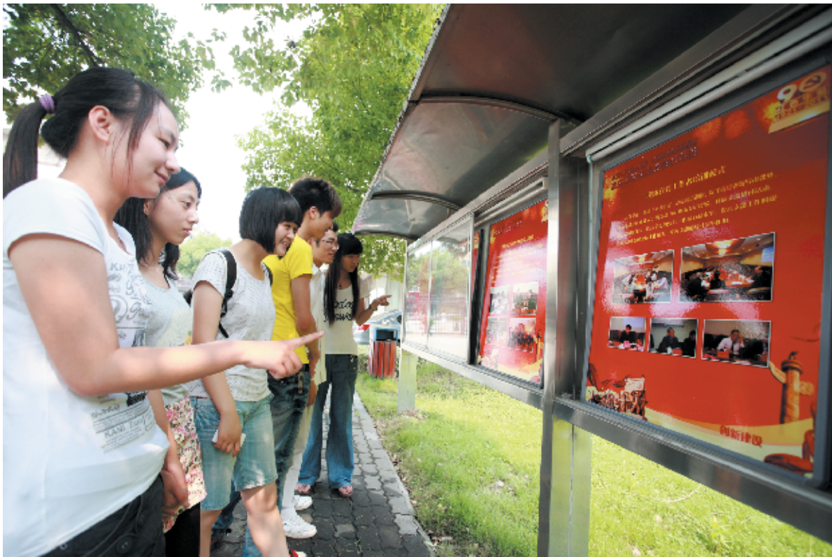
党建成果展引学生驻足

6月13日,为展示升本以来我校党建工作取得的丰硕成果,以实际行动庆祝党的90周年华诞,党委宣传部联合党委组织部在学校宣传栏展出了题为“红旗漫卷映嘉院,风劲扬帆正当时”的党建成果展。图文并茂的展陈内容吸引了众多学生观看。