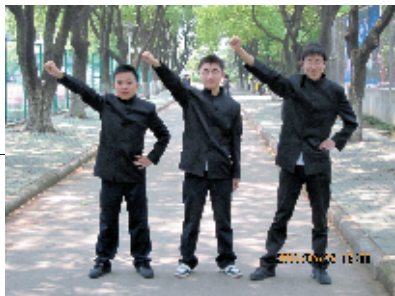
向着新的目标勇往直前

诸如此类的大学生活片段还有很多很多，每每回忆起来，酸甜苦辣，各种滋味让我回味无穷。也正是有了这些点滴，才使我们的大学生活变得有滋有味。