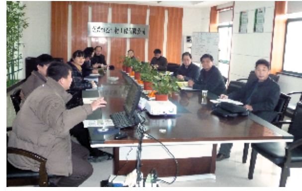
校领导看望下企业的博士

合作,不断加强与嘉兴各县(市、区)的科技对接活动,着力构建博士下企业、创新团队进行行业的“双服务”模式。主动介入打造浙江区域科技副中心、第三批国家科技进步示范市和国家创新型试点城市行动,积极参与地方政府决策咨询服务工作,多项软科学研究成果被政府部门采纳,学科服务地方的能力显著提升,并逐渐与地方形成了长期、稳定、全面的科技合作关系。