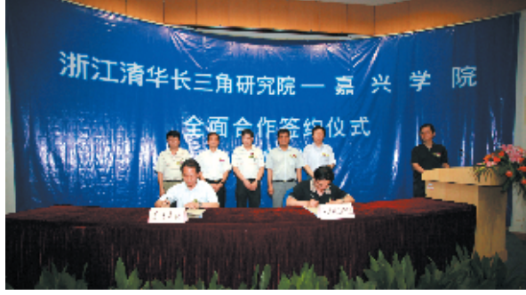
学校与浙江清华长三角研究院签订全面合作协议

“十一五”期间,累计投入实验室建设经费1.25亿元,实验室建筑面积达77433平方米,教学科研仪器设备总值1.67亿元。学校现有1个国家级实验教学示范中心建设点,5个省级实验教学示范中心建设点,1个省重点科技创新团队,3个嘉兴市重点科技创新团队,5个嘉兴市重点实验室,9个校级实验中心。建成“一卡通”数字化校园系统和网上学习系统。图书馆现有纸质图书148万册,电子图书120万册,中外文数据库20余个。