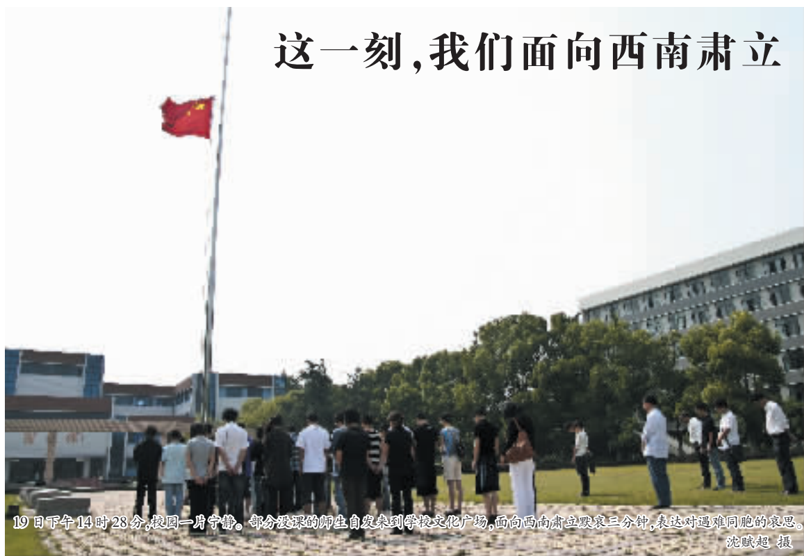
19日下午14时28分,校园一片宁静。部分没课的师生自发来到学校文化广场,面向西南肃立默哀三分钟,表达对遇难同胞的哀思。

对所有中国人来说,2008年5月12日将成为一个永远无法忘却的惨痛记忆。汶川地震之惨烈,是为国殇。那些生死相夺的瞬间,使父母永失其所爱,儿女永失其所亲。汶川成为国人血脉同搏、泪水共流之所在。我们悲伤于受灾同胞的生命流逝与生存艰难,我们感动于心手相连的生死营救和举国驰援。在哀悼与祈祷之时,总有这样一种力量让我们泪流满面:那就是和衷共济、众志成城、百折不挠、万众一心的民族传统。