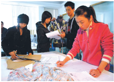
学生在服装企业实习