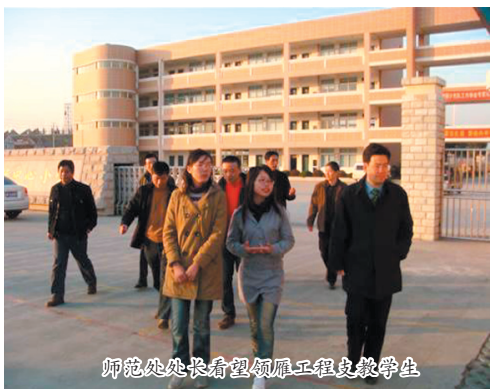
师范处处长看望领雁工程支教学生