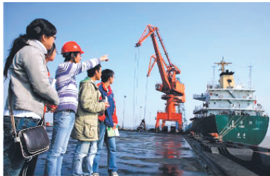
学生参观乍浦港区

在2008年进入平湖校区的500多名新生中,有400多名选择了校区为平湖企业量身定制的服装艺术设计、应用日语、涉外会计等专业,这些学生将有望成为平湖企业急需的高学历应用型人才。