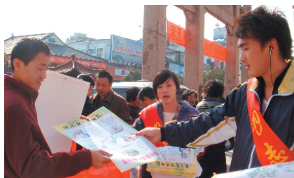
校区团委与平湖市消防大队联合开展消防宣传活动

研究,多次组织论文征集和评比活动,加强对思政课题的指导,结合校区实际,深入开展专题研究。