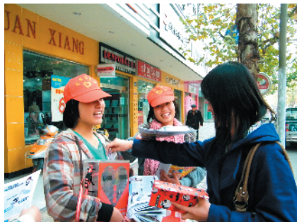
志愿者参与嘉兴广播电视报社爱心义卖