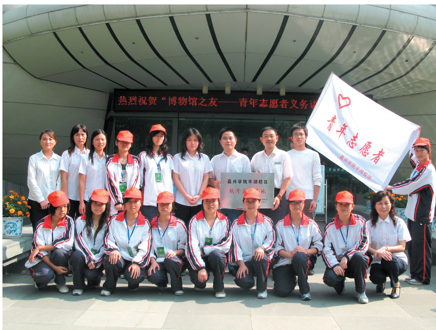
校区团委与平湖市李叔同纪念馆共建校外实践基地

积极实施高校政治理论教育建设工程,不断强化课堂教学的主渠道作用。认真抓好集体备课、教学观摩等环节,采用现代化教学手段,切实增强教学效果,充分发挥课堂教学在学生思想政治教育中的主渠道作用。加强学生工作