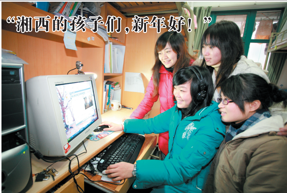
“湘西的孩子们,新年好!”

继往开来谱新篇,豪情满怀向未来。新的形势,新的任务,新的责任,它需要我们全校师生员工付出更为艰辛的努力,也需要广大校友、社会各界人士一如既往的关心和支持。我们要以党的十七大精神为指引,深入学习实践科学发展观,继续解放思想,实事求是,与时俱进,坚持改革开放不动摇,促进科学发展不放松,进一步增强政治意识、创新意识、机遇意识、忧患意识,充分估计学校发展道路上的各种困难和风险,进一步抓住和用好我校发展的重要战略机遇期,不断提高教育教学质量、科研能力和办学水平,不断开创学校各项工作的新局面。祝愿大家在新的一年里工作顺利、学习进步、身体健康!