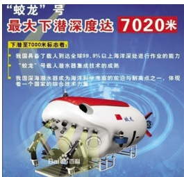
蛟龙号 7020 米深潜成功

第六，积极地引导海洋秩序的发展。在海洋这个领域之间，有专门的机构管理，例如海洋法的法庭，大陆架划分委员会，还有国际海底管理局，联合国大会等等。在这些国际舞台上，不断有中国籍的法官、委员或代表参与。我国还在积极倡导建立海洋秩序，我国的吕文正教授连任四届大陆架界限委员会委员，为维护我国的海洋权益做出了卓越贡献。