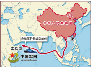
我海军护航编队航线图

资源。渔业资源方面，周边海域一直是我国数百万渔民，乃至数百万家庭的传统渔场，与我国是密切相关的。但是海域划界争端的凸显，我国一部分渔场在他国专属经济区内，围绕渔业资源和海上资源频频发生争论和纠纷。斗争最为激烈的还是海底资源的争夺，六七十年代，联合国在南海进行了一次地质普查。普查的结果既令人鼓舞，同时又引发利益冲突。报告认为南海有可能成为第二个波斯湾。于是无论域外，还是域内国家都把目光投向南海海底资源。