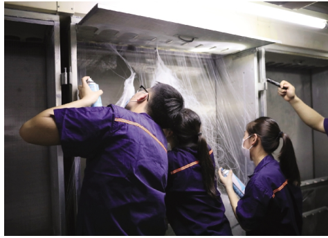
学生在基地实践训练