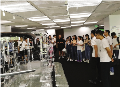
学生在基地参观学习

“依托该基地,我们还将实施双聘计划,打造一流的应用型师资队伍;对接长三角现代纺织产业,深化产教融合应用型人才培养;深化国际合作,推进‘国际化+产教融合’战略。”长三角现代纺织产业人才培养产教融合实验实训基地负责人介绍。