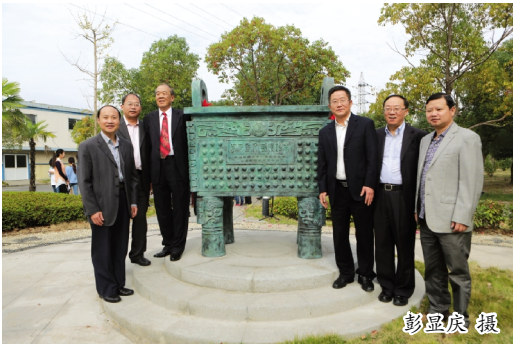
铜陵校友会向母校捐赠“桃李鼎”。