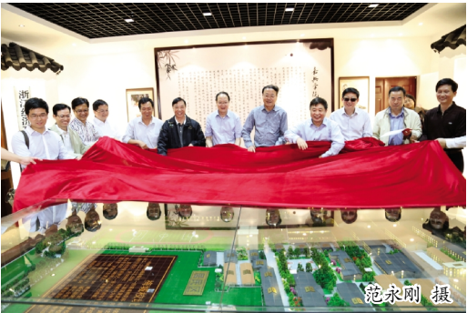
杭州校友会向母校捐赠“梅城校址”沙盘模型。