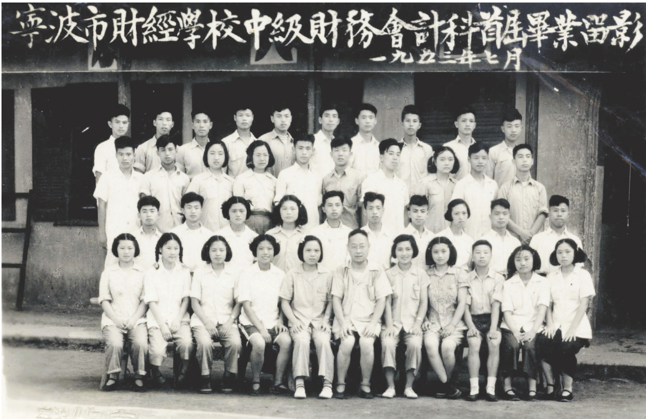
新中国成立后第一届财务会计专业中专毕业生合影