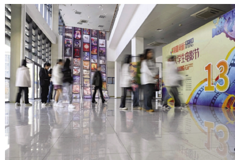
11月22日,第13期嘉兴大学生电影节开幕式在嘉兴学院举行。

近日,在浙江省第十三届高校青年教师教学竞赛中,我校商学院智佳宁、医学院朱佳、马克思主义学院王磊分别获得文科组一等奖、医科组一等奖、思政组二等奖。省高校青年教师教学竞赛每两年举办一次。本次竞赛由省教育厅、省教育工会主办,来自全省93所高校的298名选手报名参加入围赛,经专家评审,共有65所高校的137名选手进入决赛。