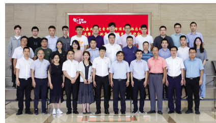
嘉兴学院第一、二批赴平湖市顶岗锻炼青年教师合影

企业博士后工作站开展研究博士 39 名;与平湖市政府达成“智汇平湖·嘉人驻企”战略合作协议,已选派 14 名青年骨干教师赴平湖市顶岗锻炼,搭建形成“政府、企业、高校、青年教师‘四位一体’校地合作新模式”,为金平湖新崛起注入了新动力。