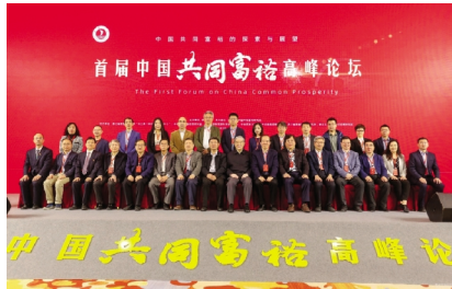
嘉兴学院举办首届中国共同富裕高峰论坛

国际科技合作、孵化培育科技创新型企业与人才项目等方面的工作。目前,研究院建设了创新研究中心和科技创新型企业共 20 余家,其中院士领衔中心 5 个。