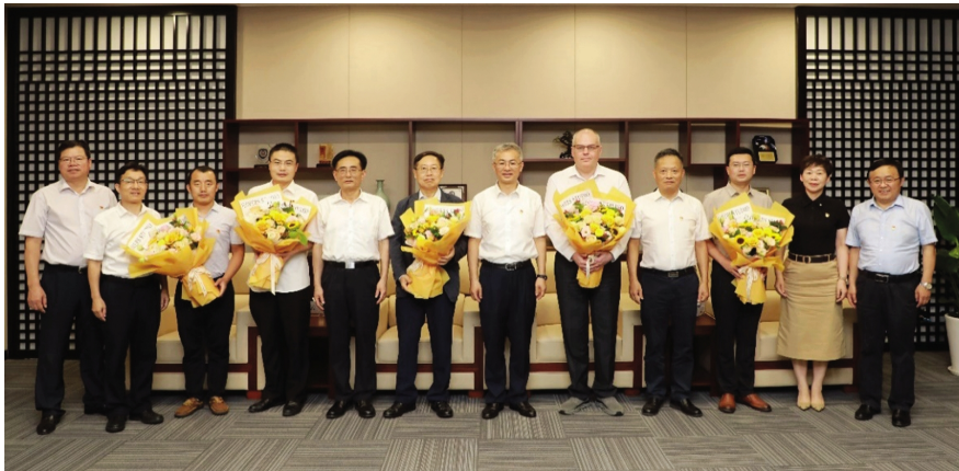
嘉兴市委副书记、市长李军一行来校慰问高层次人才

近日,嘉兴学院党委书记卢新波在题为《大力实施人才核心战略,持续优化人才引育生态,为学校实现蝶变跃升提供强有力的人才支撑》的讲话中指出,在省市党委政府的大力支持下,在省教育厅的正确领导下,经过全校上下的共同努力,嘉兴学院引进全职院士 3 名、省级以上人才 20 余人,高层次人才引育工作取得突破性进展,良好的人才生态正在快速构建。