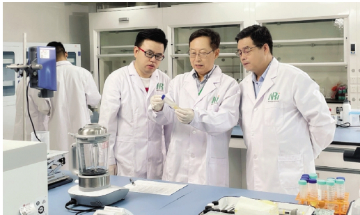
洪淳亨院士指导团队成员做实验

嘉兴学院作为第一完成单位的科技成果“纳米磷酸锆载银抗菌纤维关键技术及产业化”获得 2021 年度浙江省科学技术进步三等奖,这是嘉兴学院纳米技术研究院成立以来获得的第一个省级重要奖项。2019 年,嘉兴学院在嘉兴市政府的大力支持下引进了韩国工程院院士、韩国科学技术研究院院士洪淳亨。2020 年,学校组建了洪淳亨院士领衔的纳米技术研究院。研究院主要研究领域包括先进纳米材料的制备和表征,纳米器件的加工和测试,以及纳米科技在能源、环境和医疗等领域应用。成立至今,纳米技术研究院团队成员获批国家自然科学基金 6 项、浙江省自然科学基金 10 项,发表 SCI、EI 论文 42 篇,获发明专利 34 件,累计到账科研经费 420 万。