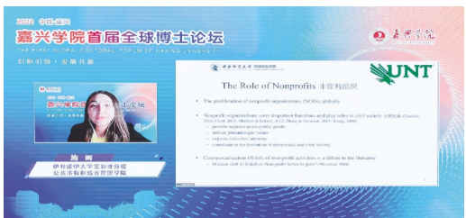
嘉兴学院举办首届全球博士论坛

嘉兴学院深入实施人才强校战略,成立党管人才工作领导小组、人才服务联盟、人才引进协同联盟,构建了党委统一领导、党政齐抓共管、校院协同推进的人才工作格局,形成了“启航”“百青”“勤慎青年学者”“南湖学者特聘教授”人才梯队培养体系,并创新方式积极面向全球延揽高层次人才。学校充分利用政府、高校和企业各方优势,通过“三位一体”协同引育人才机制,切实加强高层次人才引进及培养。学校通过人才信息共享、协同申报“国家级引才计划”“省级引才计划”“省万人计划”等人才项目、与企业共聘海外高端人才等方式,全球范围内引进了一批高层次人才。