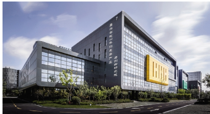
嘉兴学院 G60 科创走廊产业与创新研究院

嘉兴学院 G60 科创走廊产业与创新研究院获评 2022 年度浙江省中小企业公共服务示范平台,这是研究院继 2021 年获评浙江省新型研发机构后,又一次入选省级示范名单;研究院还获批浙江省博士后工作站,同时负责运营嘉兴高新技术产业园区国家级博士后工作站,将为嘉兴学院建设一流应用型综合性大学提供强大助力。