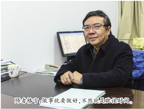
师者格言:做事就要做好,不然就是耽误时间。

担任湖南大学博士生导师,主持国家自然科学基金多项,参与国家 863 项目,发表研究论文 30 余篇,出版教材 2 部。获得嘉兴学院第二届“我心目中的好老师”称号。