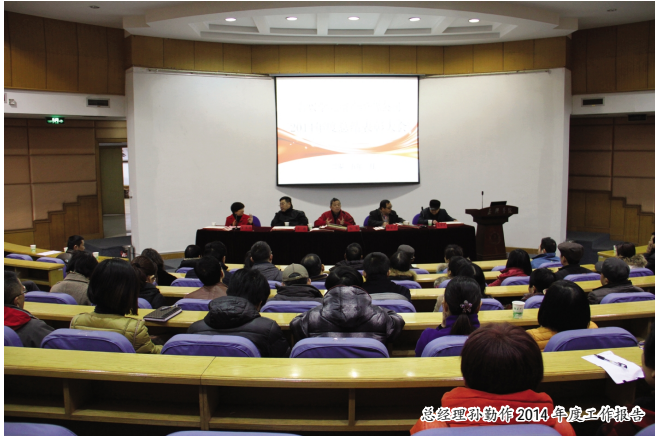
总经理孙勤作 2014 年度工作报告