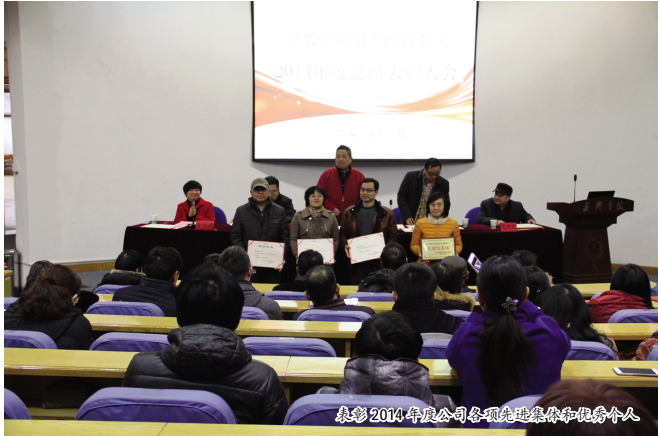
表彰 2014 年度公司各项先进集体和优秀个人