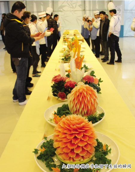
大家纷纷掏出手机拍下美丽的瞬间