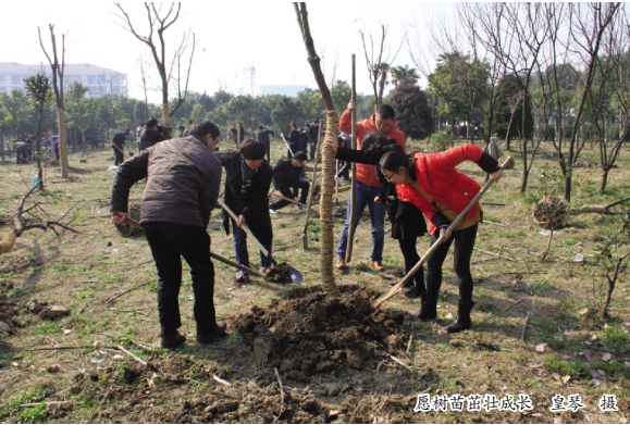
植树活动现场

阳春三月,万物复苏,伴着明媚的阳光,又迎来植树造林的好时节。为纪念全国第37个植树节,营造人人植树造林、美化校园环境的良好氛围,3月12日上午,学校在梁林校区校友林组织义务植树活动,校领导、各机关职能部门及直属单位60余人参加。