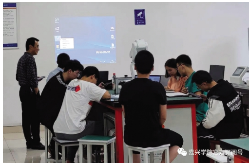
企业导师辅导学生