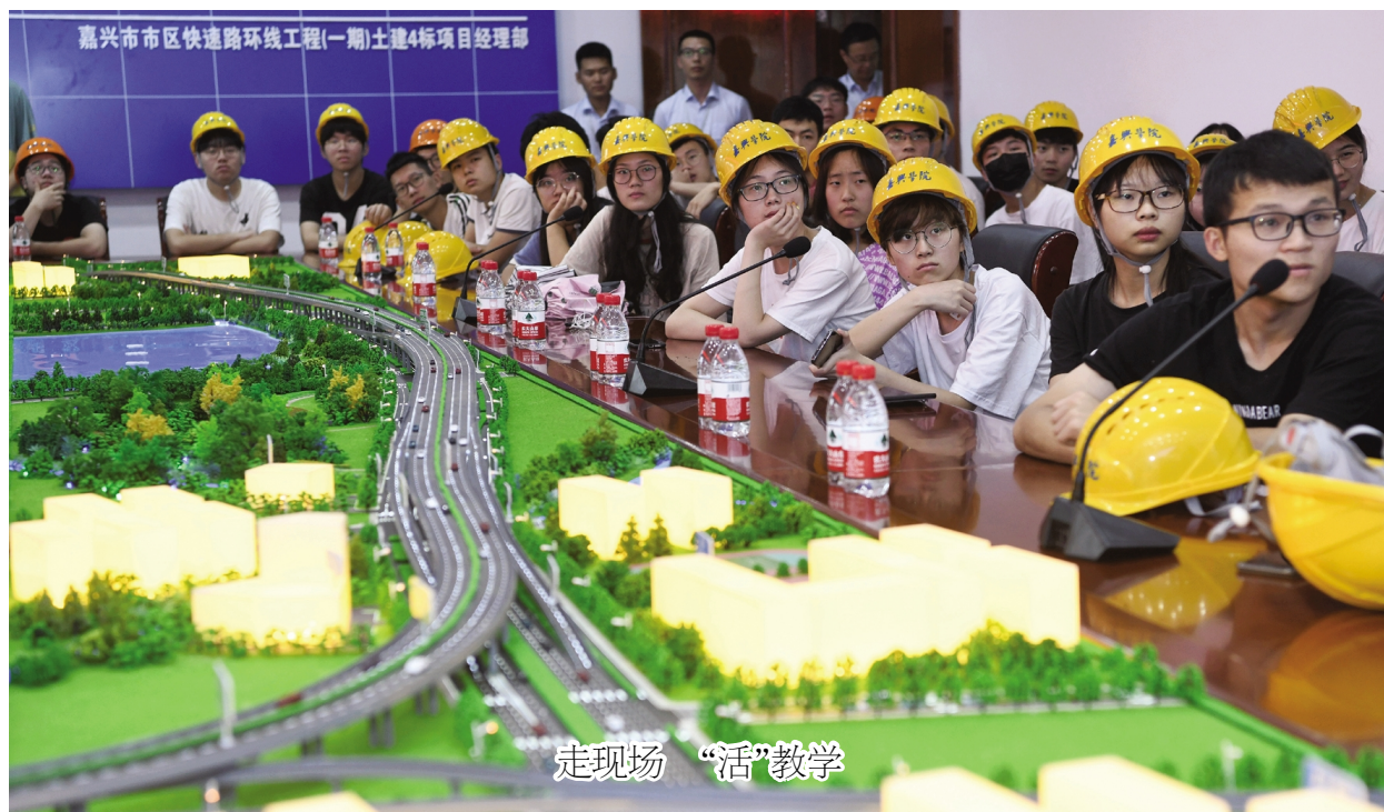
6月20日,工程管理专业的学生们在老师的带领下来到市区快速路环线工程(一期)土建4标项目部和施工现场,不仅一睹该标段的快速路沙盘,还与工程师现场互动,提问求教。这种把课堂“搬”到实地现场的做法,让工程管理的理论知识一下“活”了起来。

又讯 6月21日上午,学校在梁林校区TCL报告厅举行学位授予仪式。盛颂恩为389名毕业生代表颁授正冠,并为学校首届46名获得荣誉学士学位毕业生代表颁发证书。