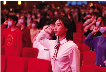
(新生入学宣誓仪式)