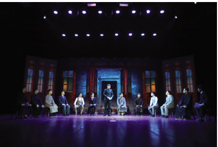
(红色话剧《初心》演出现场)