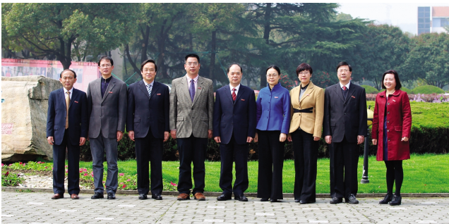
新一届纪委会委员合影

大会号召,全校各级党组织和全体共产党员要严格遵守党的政治纪律、组织纪律和廉政纪律,自觉加强思想建设,坚定理想信念,改进工作作风,勇于担当,顽强拼搏,以更加良好的精神状态和工作作风投身“有特色、善创新、高水平的地方应用型大学”建设,为实现学校第三次党代会确定的各项目标、任务做出新的更大的贡献!