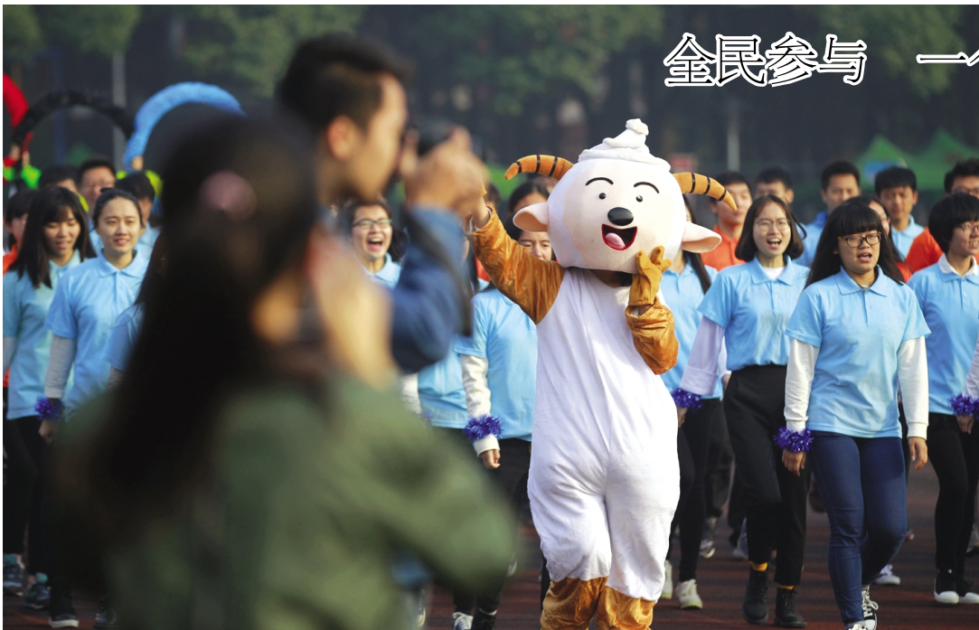
全民参与 一个不少

省教学成果奖每四年一评,此次高等教育教学成果奖面向全省所有108所高校(含浙江大学和所有高职院校)共评出一等奖100项、二等奖150项;基础教育教学成果奖面向全省高校及基础教育界共评出一等奖40项、二等奖100项。