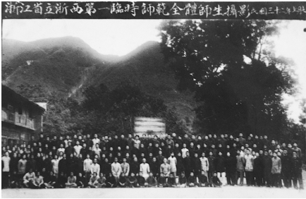
抗战时期浙西第一临时师范师生合影