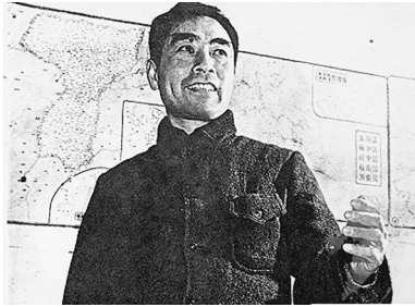
1939 年周恩来来校视察并发表抗日讲演