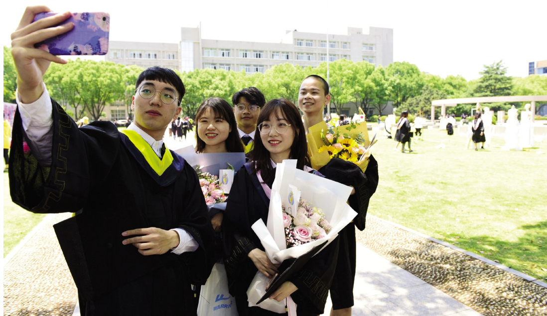
定格青春 告别嘉院

据悉,本届大赛由共青团浙江省委、浙江省教育厅、浙江省社会科学院、浙江省科学技术协会、浙江省学生联合会共同主办,浙江理工大学承办,全省71所高校1203件作品参加省级复赛,覆盖全省3万余名大学生。经复赛选拔,43所高校的268件作品入围省级决赛,共决出特等奖31项。