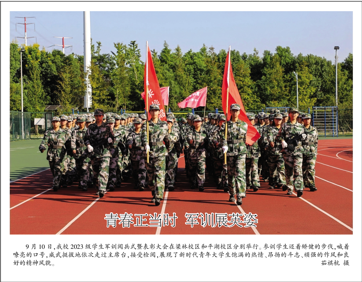
青春正当时 军训展英姿

本报讯(组织部通讯员) 8月17日,学校党委主题教育专题民主生活会召开。省委主题教育第十七巡回指导组组长蒋珍明、副组长余建森到会指导。校党委书记卢新波主持会议。 卢新波代表班子作对照检查,从理论学习、政治素质、能力本领、担当作为、工作作风、廉洁自律等6个方面深入查摆存在的问题,围绕反面典型案例进行深刻剖析,深挖问题根源,并明确了下一步整改措施。随后,卢新波带头作个人对照检查,班子其他成员依次进行了对照检查,相互开展了批评。 蒋珍明对专题民主生活会进行了点评。他指出,民主生活会是党内政治生活的一项重要制度,学校党委高度重视,会前准备充分,取得很好效果,会上班子成员之间进行了严肃认真、积极健康的批评,自我批评见人见事见思想,深挖思想根源,反映出学校党委班子团结,有凝聚力、战斗力。他认为,此次主题教育,学校党委高度重视,部署科学周密、实施扎实有力,特色鲜明,取得如期效果。他要求,理论学习永无止境,要静下心来读原著,学原文、悟原理,进一步加深对习近平新时代中国特色社会主义思想和党中央大政方针的理解,做到常学常新、常悟常新;干事创业永无止境,要认真落实习近平总书记浙江工作期间致学校办学90周年贺信精神,在补短板、强弱项的同时,集中精力扬优势、创特色,扎实推进学校高质量发展取得新成效。 卢新波代表班子作表态发言。他强调,要按照上级组织的要求将抓好专题民主生活会问题整改融入主题教育整改整治,细化完善整改措施,明确整改时限,落实整改责任,进一步巩固提高主题教育成效。要坚持对标对表,加强政治建设。学校党委班子将持续将政治建设放在首位,带头锤炼对党绝对忠诚的政治品格,坚持把政治标准和政治要求贯穿到各项事业之中,不折不扣把党中央决策部署落到实处。要坚持立行立改,抓好问题整改。班子成员要提高站位,对照专题民主生活会查摆出来的问题,细化整改措施,狠抓推进。要压紧压实责任,切实履行“一岗双责”,动真碰硬抓实整改整治,标本兼治跟进建章立制,确保整改整治取得实实在在成效。要坚持聚焦聚力,推动攻坚克难。学校党委班子要以此次专题民主生活会为契机,努力把整改整治成效转化为推动工作动力,不断优化学科专业体系,大力实施人才强校战略,深入开展有组织高质量教学科研,优化学校内部治理体系,全方位推进学校事业高质量发展,为加快建设有特色、善创新的一流应用型综合性大学作出应有贡献。