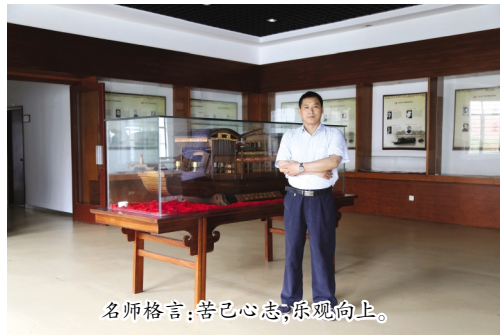
名师格言:苦心志,乐观向上。

曾在《民国档案》、《学术界》、《社会科学战线》、《党史纵横》等刊物发表学术论文30余篇。2006年6月出版专著《抗战时期国民政府缉私研究(1931—1945)》;2014年5月出版专著《抗战时期国民政府关税政策研究(1937—1945)》。主持并完成国家社科基金后期资助项目《抗战时期国民政府关税政策研究(1937—1945)》,主持并完成湖南省社科基金项目《中国共产党抗日根据地缉私研究》,目前正在主持国家社科基金后期资助项目《袁殊研究》和教育部人文社科重点研究基地项目《五四时期社团与中国共产党创建研究》。