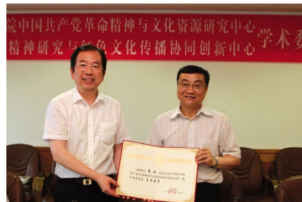
2014 年 6 月 21 日,我校中国共产党革命精神与文化资源研究中心暨红船精神研究与红色文化传播协同创新中心第一届学术委员会和理事会会议在校行政楼三楼会议室召开。