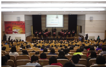
2013 年 3 月 23 日,学校在梁林校区 TCL 报告厅举行党章知识竞赛。