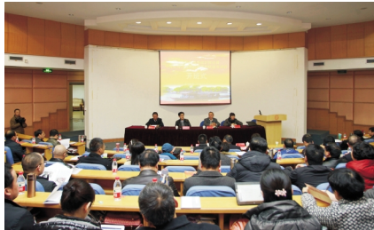
2013 年 6 月,学校获批成为首批全国高校思想政治理论课教师社会实践研修基地。