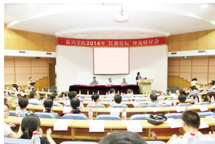
2014 年 6 月 27 日,学校在行政楼一楼报告厅召开 2014 年“红船论坛”理论研讨会。