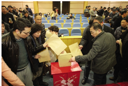
2014 年 2 月 27 日,学校在行政楼一楼报告厅召开党的群众路线教育实践活动总结大会。会议还对未参加党的群众路线教育实践活动的党外校领导 2013 年度工作进行了考核。