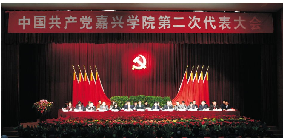
2009 年 12 月 25 日至 26 日,中国共产党嘉兴学院第二次代表大会在学校第二教学楼报告厅举行。

落实党风廉政建设责任制,构建学校惩治和预防腐败体系,强化领导干部“一岗双责”,切实提高拒腐防变能力。建立校院两级党风廉政建设情况分析会制度,扎实开展廉政风险排查及防控,强化对重点领域、关键环节的督查和审计监督。探索建设了全校廉政风险防控体系电子平台,推进岗位权责清晰、流程规范、风险明确、措施有力、预警及时、利于群众监督的廉政风险防控长效机制。认真贯彻落实中央“八项规定”和省委“28 条办法”、“六项禁令”,加强了科研经费、“三公”经费、出国(境)等管理,理顺了采购招标管理体制,落实采、管分离制度,持续改进工作作风,学校党风廉政建设取得新成效。