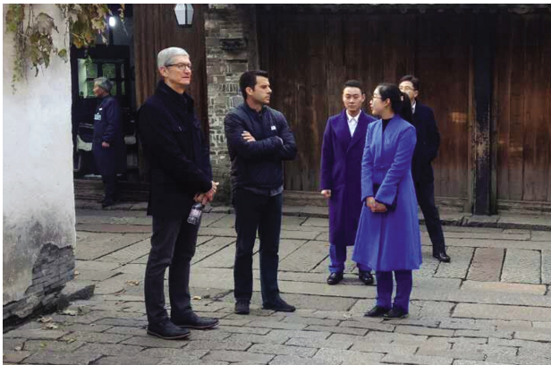
在第四届世界互联网大会上,嘉院的150名志愿者“小梧桐”主要负责大会期间参会嘉宾接站、注册报到、会展等各项服务。