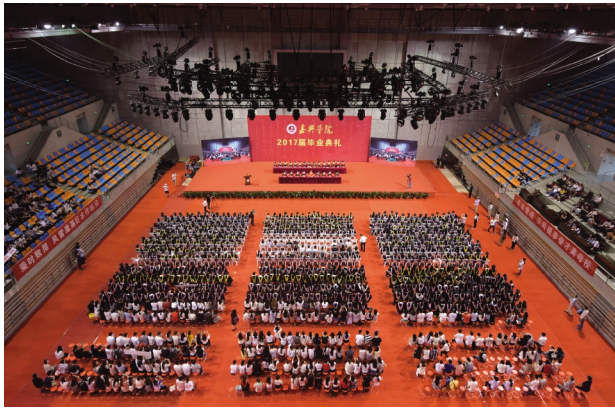
6月15日,学校举行2017届毕业生典礼,6209名嘉院学子(含专科生)完成学业顺利毕业。