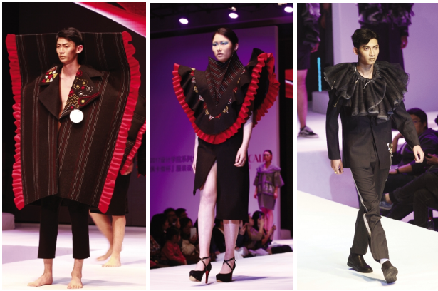
4月6日,设计学院2017系列文化展演开幕。