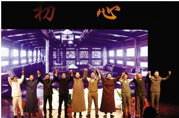
12月9日,由我校师生自编自导自演的红色正剧《初心》正式上线。