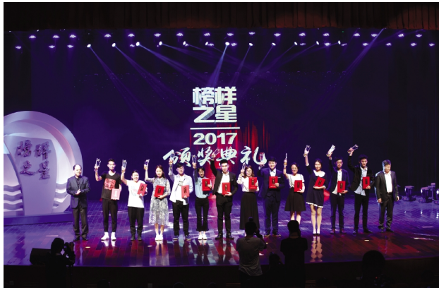
5月4日,我校举行嘉兴学院纪念建团95周年暨第七届“榜样之星——最具影响力青年”评选活动颁奖典礼。