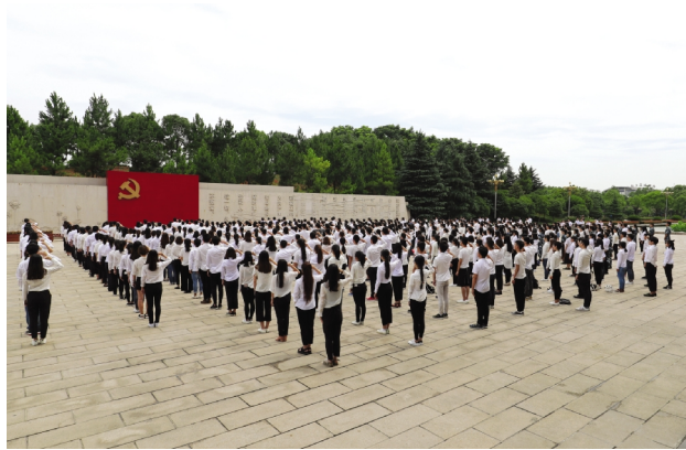
6月18日,我校在南湖革命纪念馆举行新党员入党宣誓仪式。学校537名新党员参加了本次宣誓活动。