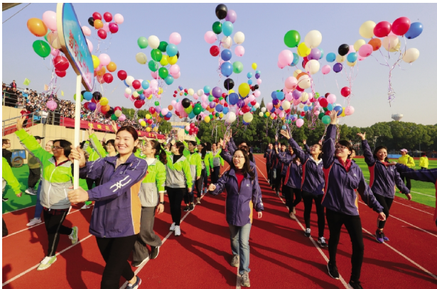
11月3日,我校第十七届体育运动会暨田径比赛在越秀校区田径场开幕。