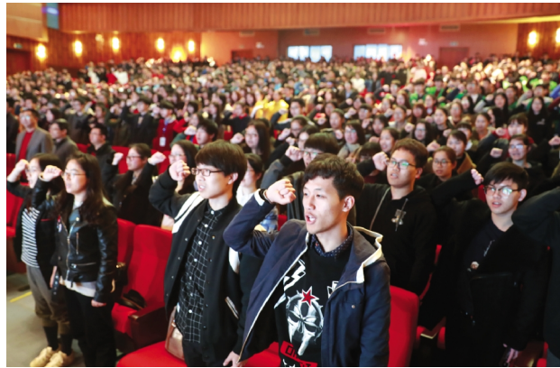
3月30日,我校举行大学生助力“剿天劣V臭水”行动出征仪式。