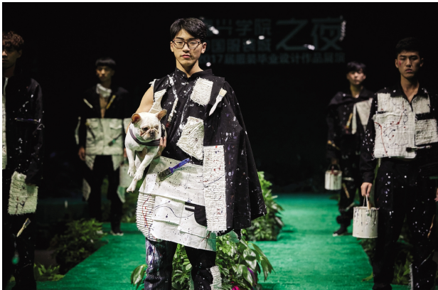
5月26日,“中国服装城之夜”——嘉兴学院应用技术学院2017届服装毕业作品展演在平湖·中国服装城广场举行。