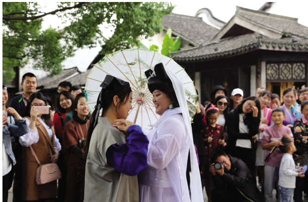
在第五届乌镇戏剧节上,由嘉兴学院欢乐逗逗表演工作室带来的《白蛇新传》在乌镇街头开演。