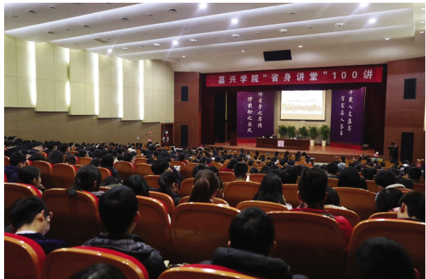
12月12日,“省身讲堂”迎来第100讲。自2007年开讲以来至今已近十年整,直接受众累计已达到10万多人,现出版《省身讲堂演讲录》三辑。