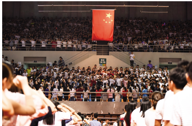
9月17日,学校举行2017级新生开学典礼。来自全国各地的6159名新生成为嘉院新力量。