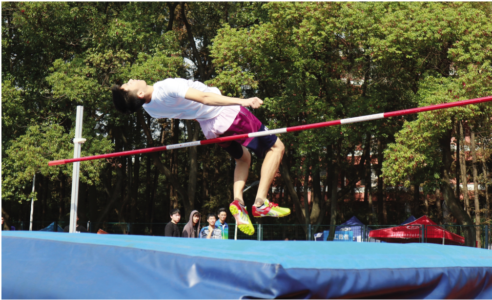
百尺竿头 更进一步

评审工作基本结束后,参会专家还共同观看了由我校学生自编自导自演的红色话剧《初心》。