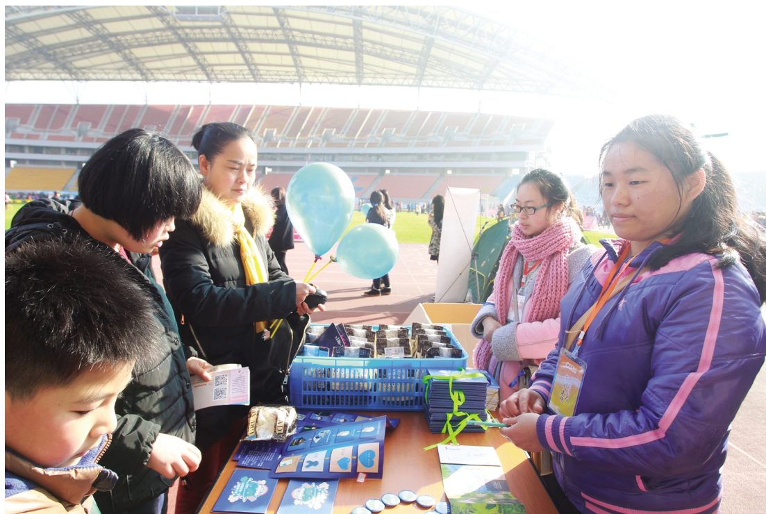
1月1日,新年伊始,外国语学院26名“星沟通”团队成员和党员志愿者来到嘉兴体育场,为关爱自闭症儿童举行公益宣传与义卖活动。此次活动为期三天,希望通过多种活动形式让更多人了解、走近、关爱自闭症儿童。活动共募集善款近千元,均用于关爱、帮扶自闭症儿童及其家庭。

衷心祝愿我校教育事业兴旺发达、蒸蒸日上!祝愿全体师生员工、广大校友和各界朋友节日快乐、阖家欢乐、幸福安康!