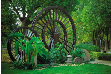
江南耕读文化园区