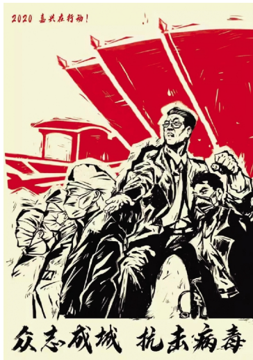
海报4 设计学院学生 王景涵