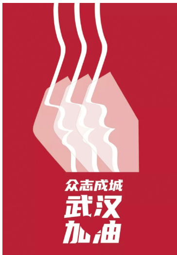
海报1 设计学院教师 姚凌骏

为那四月的樱花,热闹的街市,千古绝唱的黄鹤楼,我们一同努力,消灭病毒,打赢这场没有硝烟的战争!