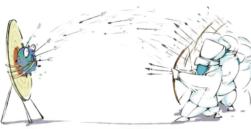
漫画2 设计学院学生 程铁男