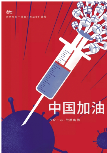
海报3 设计学院学生 汪钰敏