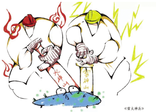
漫画4 设计学院学生 程铁男

两百里外,长江在轰鸣两千里外,黄河在怒吼此时此刻,北纬三十度的江南梅花开了,逆行者正在一线奋战庚子年春节,我们以国为母,同舟共济待到烟花三月,共赴樱花之约