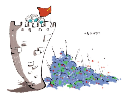
漫画5 设计学院学生 程铁男