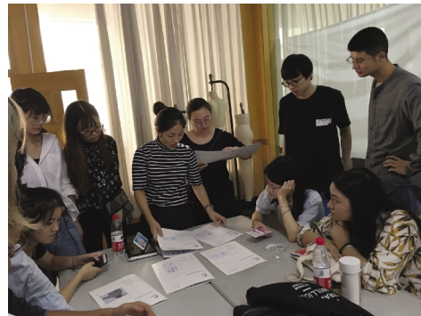
华城企业导师辅导学生