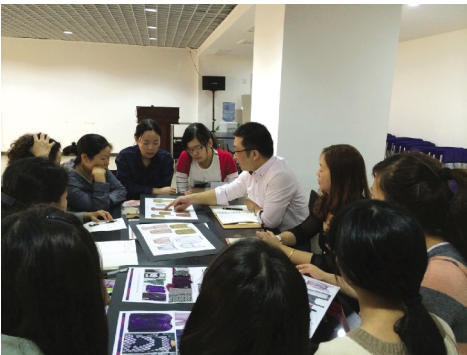
梦迪校外导师给学生上课

建课程 12 门、企业参与授课 18 门(其中省级一流课程 6 门),入选省级以上教材项目 7 部,获批教育部产学研合作协同育人 4 项,获德国红点设计大奖之红点最佳设计奖 1 项,学生在学科竞赛中获得省级以上奖项 90 余项,获批专利 120 余项,发表高质量论文 340 余篇。 “我们力图将产教融合‘平台’与‘模式’创新作为人才培养驱动的核心要素,通过不断集聚力量,助推产教融合贯穿时尚产业数字化智能化人才培养全过程。”实训中心负责人介绍,设计类专业与当地 40 多家时尚相关企业建立了大学生校外实践教育基地、研发中心等校企合作平台。其中,“嘉兴学院·浙江华城集团艺术学大学生实践教育基地”获批“省级校外实践教育基地”。 近年来,学校主办或承办了多场时尚产业发展相关论坛和活动,为当地打造时尚文化品牌注入了活力。产教融合育人成果先后受邀参加 2019 第十二届中国艺术节演艺及文创产品博览会(上海)和 2020 长三角国际文化产业博览会,入选 2021 年中国高等教育博览会“校企合作双百计划”典型案例,发挥了良好示范作用,形成了广泛社会影响力。