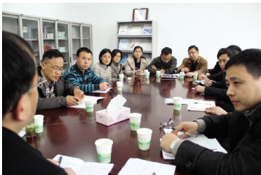
(历次“教学沙龙”活动现场)