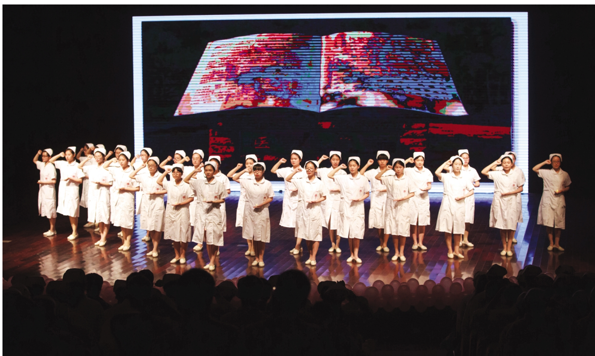
在第104个国际护士节到来之际,5月11日晚,医学院在嘉兴学院剧院举行以“南丁格尔的礼赞”为主题的护士节庆祝晚会暨2015级护生授帽传光仪式。

作风硬的干部队伍,做到始终把纪律挺在前面,严守政治纪律和政治规矩,强化“四个意识”,努力营造团结奋进、风清气正的氛围;要充分发挥基层党组织的战斗堡垒和党员的先锋模范作用,创新学校党建工作模式,充分发挥好基层党组织和每一个党员的作用。他号召,全体党员干部要以“十三五”为新的起点,以更加开阔的视野、更加昂扬的斗志、更加扎实的作风,改革创新、攻坚克难,为建成有特色、善创新、高水平的地方应用型大学而努力奋斗!