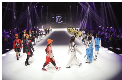
6月29日下午,中国·平湖羽绒时尚周系列活动之一的“童心匠境”——嘉兴学院应用技术学院2019届服装毕业设计作品发布活动在平湖体育馆上演。

为办好比赛服务,学校高度重视,成立了由党校办、宣传部、学工部、安全保卫处、基建处、校团委、后勤服务集团等部门组成的工作组,全面落实比赛工作联络、环境提升、宣传报道、后勤保障、安全保卫、志愿服务等事宜。学校精心的安排和周到的服务得到了与会领导、评委、参赛选手和观众的一致好评。