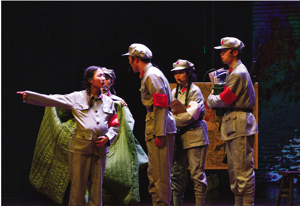
12月6日晚,我校文法学院原创红色话剧《赤色雪婴》首演暨第十八届话剧展演在梁林校区剧场举行。《赤色雪婴》讲述了桐乡优秀女儿、红军“无冕女将军”张琴秋为带领同行战友们安全转移,忍痛将刚分娩的婴儿弃于雪地的革命故事。

程树群教授是教育部长江学者特聘教授,“国家杰出青年基金”获得者,国家百千万人才工程突出贡献青年人才,享受国务院政府特殊津贴。