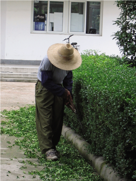
园丁正在为树木“造型”