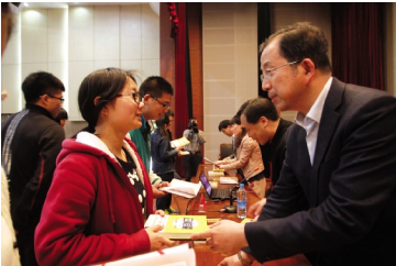
“悦读之星”颁奖典礼现场

在我们的身边,有这样一群人,他们日夜与书相伴,难舍难分,对读书这件事有着自己独到的见解。他们未必是传说中的大家,他们的看法也不见得可以被奉为主臬,对于开头提出的问题,他们可能也无法给出统一的“标准答案”,但循着他们的心迹,我们依旧能够从中获得启迪。