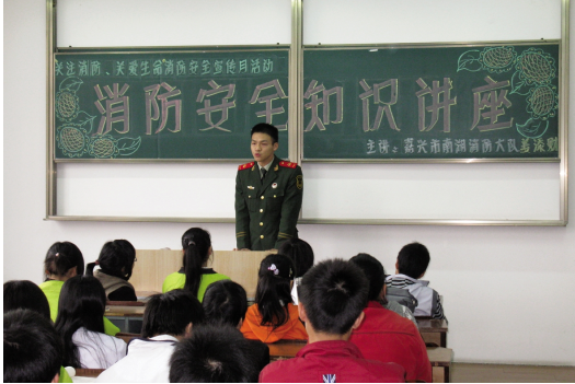
员工消防安全培训

高校公寓文化是大学校园文化的重要组成部分,是高校创建文明校园的一个窗口,对高校文明安全校园创建起着积极的推动作用。