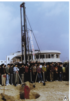
A 上个世纪八十年代,嘉兴高专实践楼奠基 B 上个世纪九十年代,嘉兴高专校园 C 上个世纪九十年代,嘉兴高专校园

1987 年 4 月 14 日省教委正式批准建立嘉兴高等专科学校。1990 年举行了 5 周年校庆活动,举办了校史展览以及校庆大会文艺演出。1991 年初经国家教委审定,由于办学条件未达到规定标准,学校被黄牌警告。面对如此严峻的存在(生存)危机,1991 年-1993 年学校将主要精力放在跑经费和项目上。学校从省市县讨要所欠经费,三年争取了三个项目。共建了 1.1 万平方米的校舍。筹集经费 800 万元。取得的成绩超出了