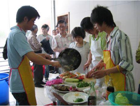
学生代表队参加校园美食节