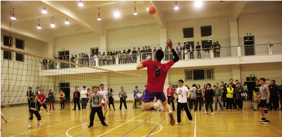
公司运动员在学校第九届教职工杯赛上奋力扣杀