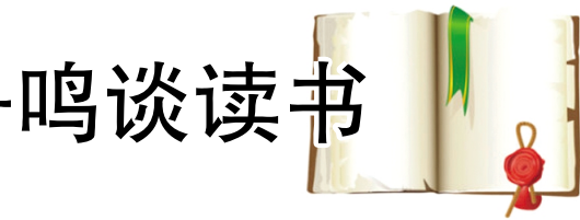
■学生记者:曹雅婷 林跃 王舒

“如果真爱一本书,会读出书背后的人,这个‘人’可以是作者,可以是作者所属的那个群体,可以是书中的人,也可以是书中内容所反映的那个时代,这一切会变得很鲜活,很有性格、有灵魂,会促使你拓展开去读与此相关的其他作品。”2012 年从湖南师范大学博士毕业后,石