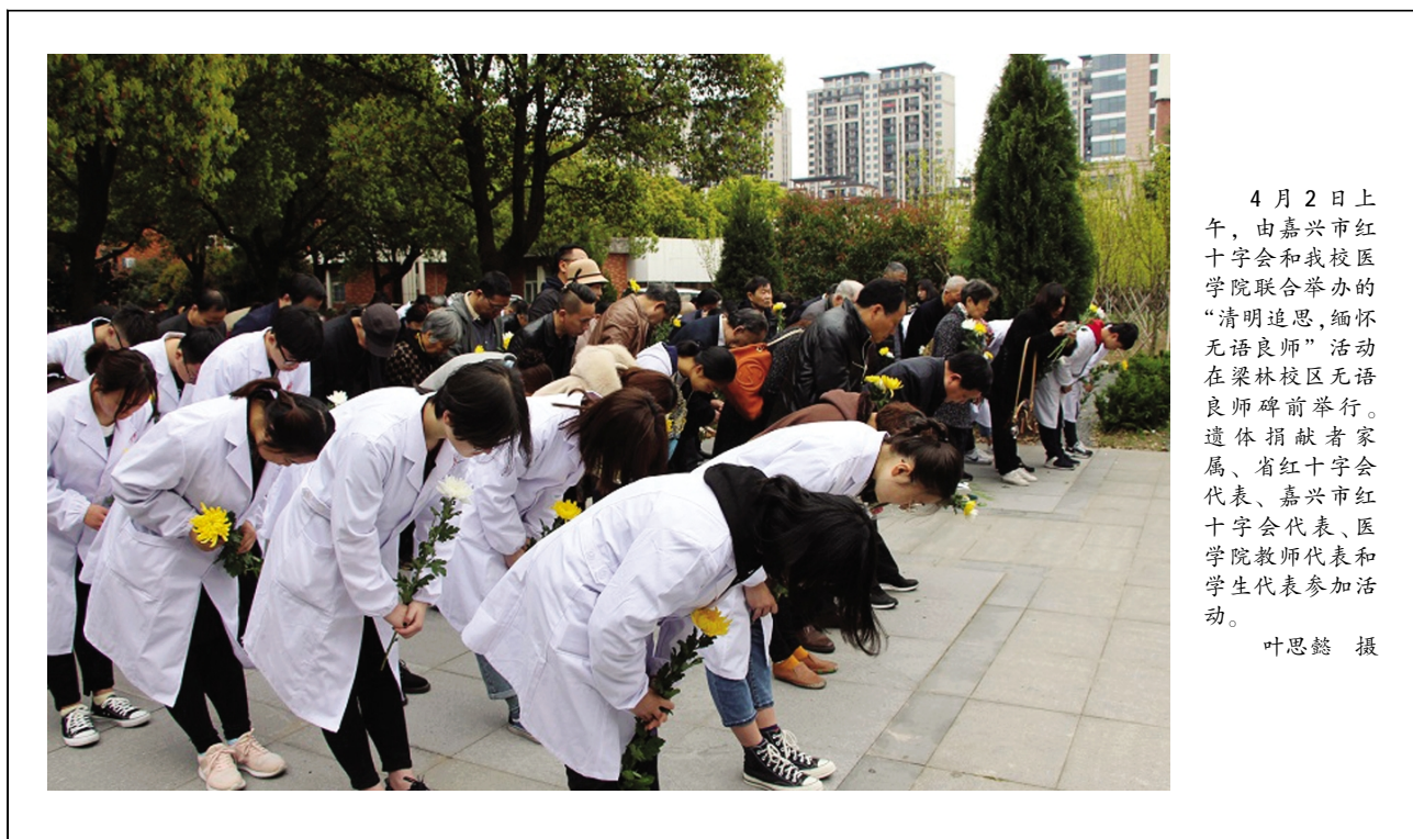
4月2日上午,由嘉兴市红十字会和我校医学院联合举办的“清明追思,缅怀无语良师”活动在梁林校区无语良师碑前举行。遗体捐献者家属、省红十字会代表、嘉兴市红十字会代表、医学院教师代表和学生代表参加活动。

□ 3月28日下午,浙江理工大学图书馆馆长张瑞林教授应邀来校图书馆作题为《浅谈高校阅读推广活动探索与实践》的专题学术讲座。