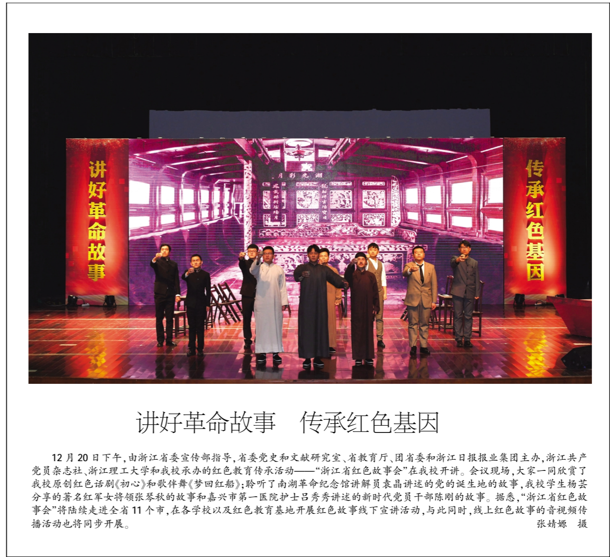
讲好革命故事 传承红色基因

大会还听取并审议了第五届工会委员会工作报告,审议了第五届工会委员会财务工作报告和经费审查报告;以投票方式选举产生了第六届教代会执行委员会、工会委员会和经费审查委员会;通过了第六届教代会提案工作委员会。