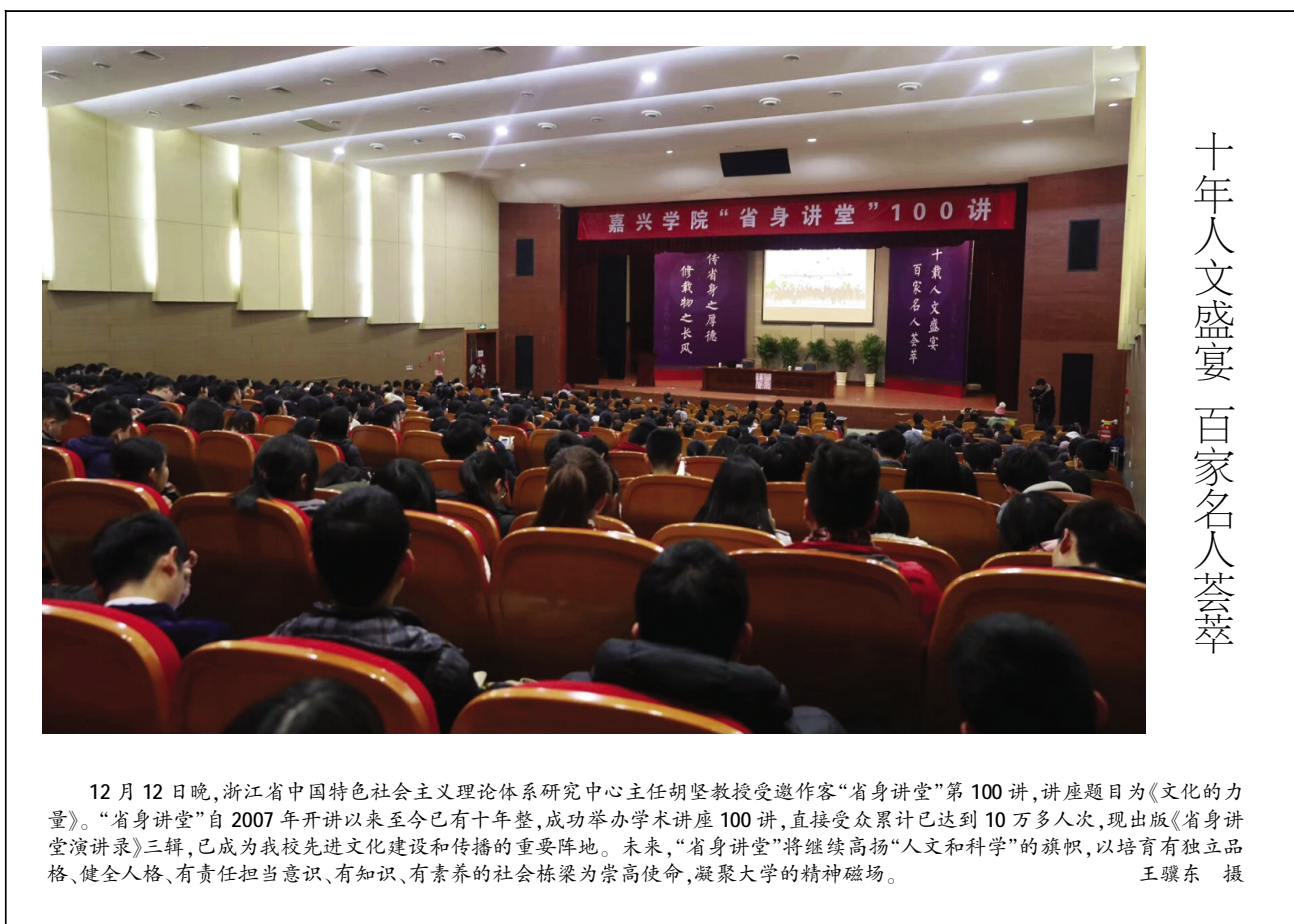
十年人文盛宴 百家名人荟萃

据悉,此前学校党委还于11月30日、12月7日分别在越秀校区、梁林校区和平湖校区,面向近1300名党员领导干部和教职员工召开党的十九大精神专题宣讲会。学校党委要求全校各级党组织和广大教职员工要以强烈的政治责任感,把学习宣传贯彻党的十九大精神作为当前和今后一个时期学校的首要政治任务,自觉用党的十九大精神指导学校各项事业发展,不忘初心、牢记使命,为全面落实学校“十三五”发展规划,加快建设高水平的地方应用型大学作出更大贡献。