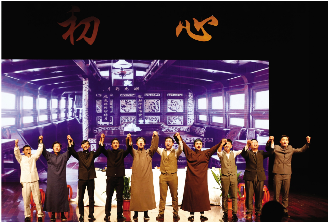
□ 宣传部通讯员 □ 摄影: 祁岚 李东楷