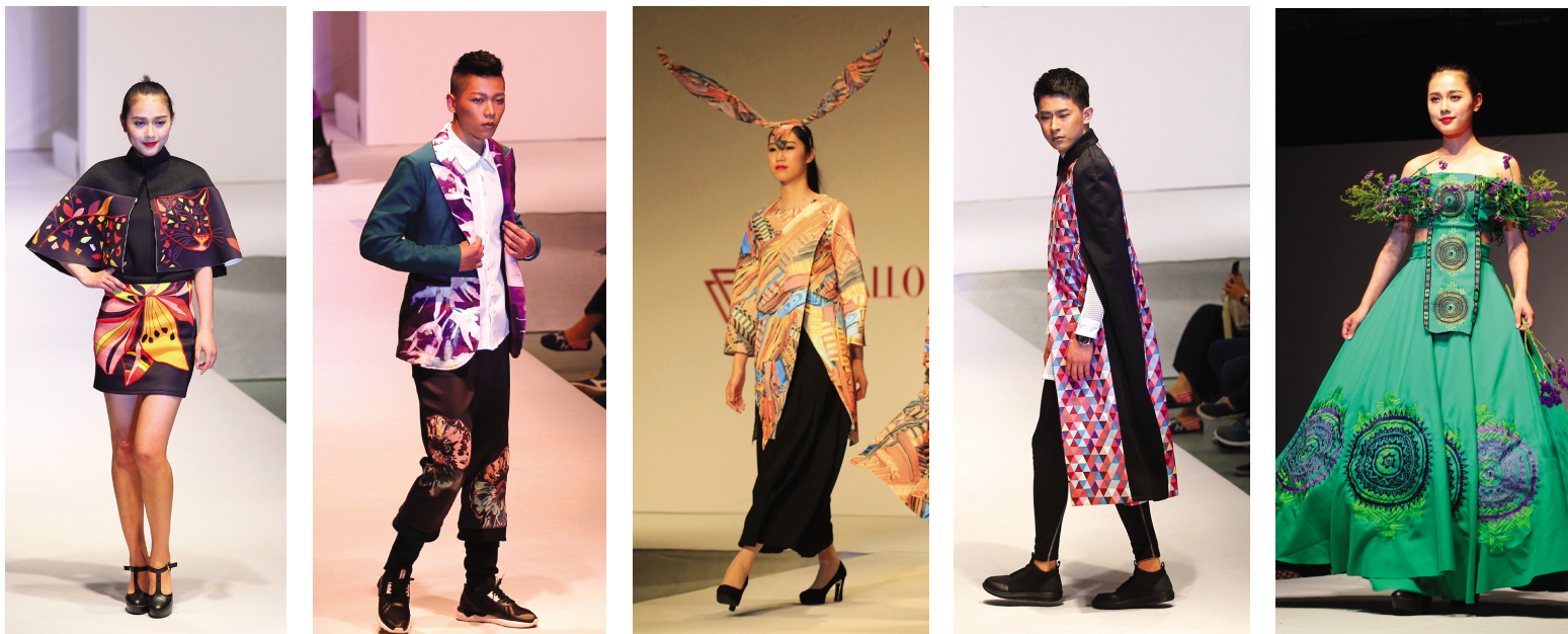
□ 摄影 缪凯怡 范永刚

今年,设计学院毕业设计展演活动总共有五大环节。除“佩卡奴杯”服装设计展示外,还有视觉传达、环境艺术设计作品展览,工业设计作品展览,学术报告活动和平面设计大赛。据悉,整个展演活动共有300多名学生参与,有近400套设计作品参展。