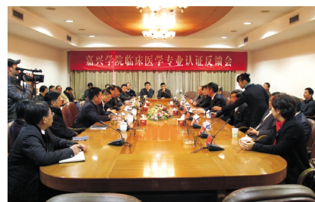
2012年,在国内同类院校、省内医学院校中,我校临床医学专业第一个接受并通过了教育部临床医学专业认证专家组的认证。