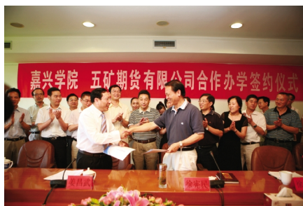
2010年,学校举行与五矿期货有限公司合作办学签约仪式,探索结合专业特色,加强校企深度合作的人才培养模式。