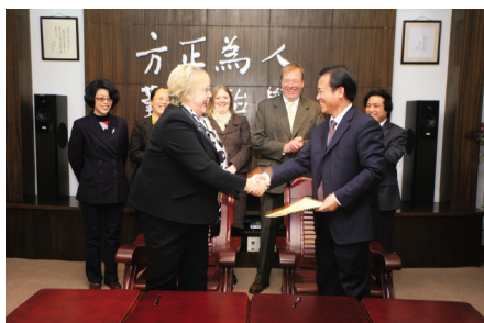
2009年,英国普利茅斯大学副校长安迪·鄱赛尔教授应邀来校访问,与我校签署了两校合作交流备忘录,正式开启了两校间的交流与合作。