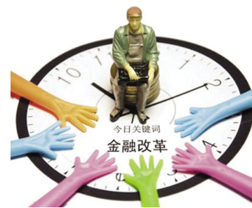
(根据录音整理,有删节,未经作者审阅)

题,第一个是关于大银行的国有控股,国家对国有控股金融机构的合理持股比例,这是需要进行研究的。第二个,民间资本进入金融副业的问题,包括发起式银行。向民间资本开放金融副业,对于缓和金融副业,优化金融的股权结构和金融市场的竞争格局,以及体现不同资本的市场公平原则,具有重要的影响。这在金融学学术界和金融管理界也有很多争论存在的,认为民营资本办银行风险较高,所以在开放的同时要加强监管,建立配套的金融基础设施。