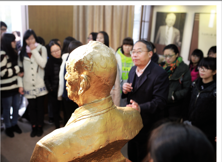
重温校训 缅怀先生

【本报讯(宣传统战部通讯员) 11月28日,省委宣传部常务副部长胡坚、省教育工委副书记、省教育厅副厅长鲍学军一行,来校调研指导文化校园建设工作。校党委书记黄文秀、校长陈颂恩及相关校领导陪同调研。 胡坚、鲍学军一行调研了学校越秀、梁林校区校园环境文化、场所文化、寝室文化建设等工作,重点走访了校史陈列馆、陈省身纪念馆、地方文化长廊、红船精神研究中心、机电家园、设计学院等场所和学院,并与师生进行了交流。 在座谈会上,胡坚、鲍学军一行听取了学校关于文化校园建设的专题汇报,对学校长期以来进行文化校园建设给予了充分肯定。鲍学军指出,嘉兴学院历史悠久、人文正脉、文化根正苗红,校园文化建设有许多好的做法和亮点,接下来重点要围绕人才培养目标要求,继续发扬纯朴务实的学校精神,不断加强学生创新能力的培养,加强时代精神的培育,要突出嘉兴学院自身特色与优势,在现有基础上精心打造升级版3.0、4.0版文化校园,高起点、高水平做好文化校园建设工作。胡坚指出,嘉兴学院党政领导高度重视文化校园建设工作,学校历史悠久,文化校园建设基础良好。下一步要在历史传承、地方特色和学校个性等方面下功夫,突出历史性、地域性、时代性,弘扬“红船精神”,以开阔大地的勇气做好文化校园建设工作,打造师生“看得见、摸得着、感受到”的文化校园。 黄文秀代表学校党政衷心感谢省委宣传部和省教育工委对嘉兴学院文化校园建设工作的支持和重视,表示要认真贯彻落实领导指示精神,高度重视,全力推进,重点保障,力求把文化校园建设落实现、落细、落小,建好有学校历史文化传统、有嘉兴地域特色、有学校文化个性的文化校园。