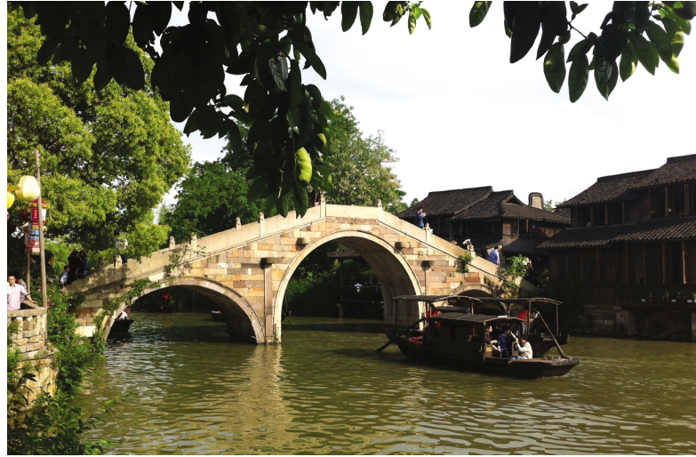
■汉语言 N122 张晓萍

乌镇位于浙江省桐乡市北端,距桐乡市区13公里,与周庄、同里、角直、西塘、南浔并称为江南六大古镇,素有“鱼米之乡,丝绸之府”美誉。乌镇是国家5A级景区,全国二十个黄金周预报景点之一,具有六千余年悠久历史。1991年被评为浙江省历史文化名城,1999年开始古镇保护和旅游开发工程。作为典型江南水乡,乌镇完整地保存着原有晚清和民国时期水乡古镇的风貌和格局。以河成街,街桥相连,依河筑屋,水镇一体,组织起水阁、桥梁、石板巷等独具江南韵味的建筑因素。