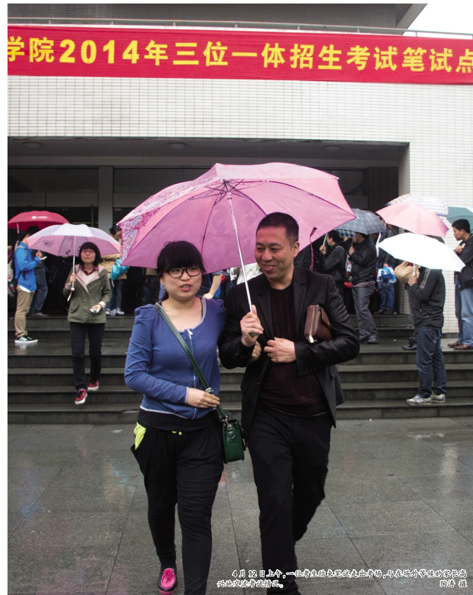
4月12日上午,一位考生在考场外等候,与在外等候的家长告别。

“同学,你好!我是志愿者,请问你是要到考场去吗?我可以帮你带路……”“您好,这边不可以停车,会阻碍交通,您可以往前右转十米,那里可以停车,谢谢!”一位胸前佩戴志愿者工作证,上臂戴着执勤标志袖章的志愿者正在热情地为考生和家长提供服务。4月12日一早,学生志愿者就已穿戴整齐,精神饱满地做好了准备,为前来嘉院参加“三位一体”综合评价招生考试的考生与家长们提供贴心服务。