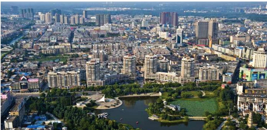
城市建设蓬勃发展