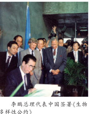
李鹏总理代表中国签署《生物多样性公约》