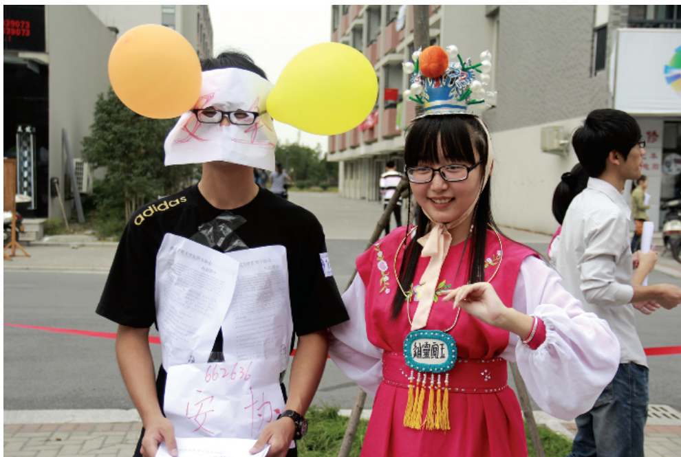
拉丁劲舞、Cosplay表演、飞行模型表演、越剧表演、书法展示……10月14日上午,我校梁林新食堂门口成了大学生才艺展示的大舞台,第十二届社团文化节暨社团招新火爆开展,45个校级社团的同学们盛装“出席”,卯足了劲吸引学弟学妹们加盟。