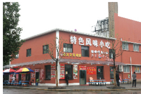
位于男生公寓二后面的特色风味餐厅

经营餐厅的蔡老板说:“中西结合的餐厅是为了给学生提供更多口味的美食,丰富学生的校园饮食种类,学生只有吃得开心才能学得开心嘛!”现在的你如果想换个口味或者想尝个鲜,还等什么,赶紧也去试一试吧!