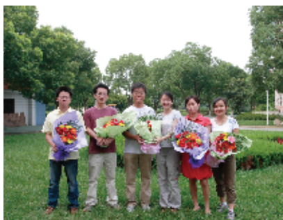
2006年的“两项计划”志愿者在校园里合影