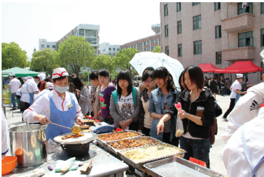
现场制作各式点心