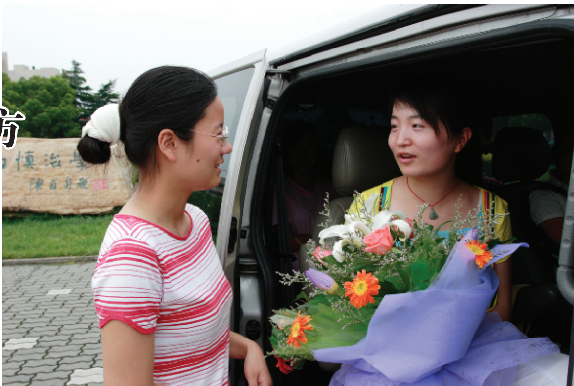
“两项计划”志愿者出发时,老师前来送别

不论是已经服务期满的志愿者,还是即将踏上服务之路的志愿者,他们都用自己的实际行动诠释了“到祖国最需要的地方去”的时代内涵,彰显了“人生的意义在于奉献”的高贵品质,让青春的光彩更加绚丽,让人生的价值愈显丰满。