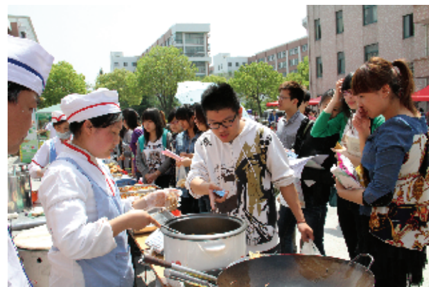
“美食一条街”人气旺