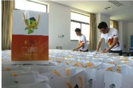
志愿者在清点核查每一个参赛资料袋