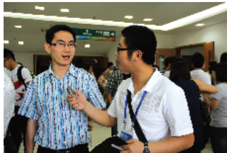
参赛高校领队接受学生记者采访