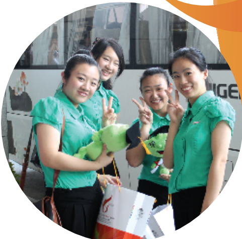
浙江师范大学的4位美女选手