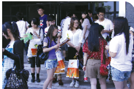
参赛团队陆续抵达报到现场