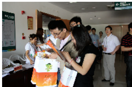
参赛选手认真阅读参赛手册