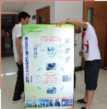
志愿者们接收参赛团队的项目展板