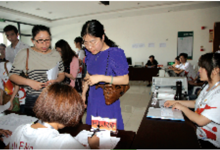
参赛团队办理校旗展板移交手续