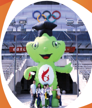
参赛选手们在场馆前与吉祥物合影留念