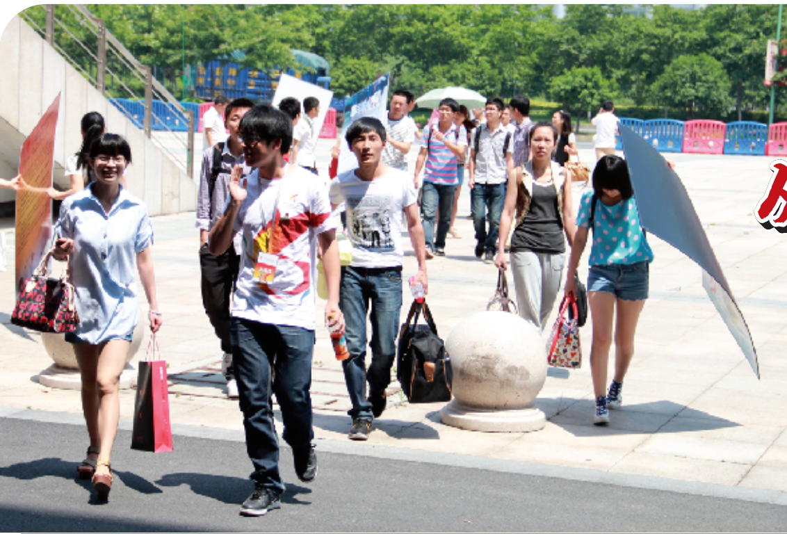
参赛选手在志愿者的带领下携带项目展板来到场馆报到点

5月18日上午9时左右,55所高校参赛团队陆续抵达嘉兴学院。在志愿者的指引下,参赛选手有条不紊地完成了各项报到手续并移交了校旗与展板。报到结束后,各参赛院校在一对一志愿者的带领下抵达下榻宾馆办理入住手续。下午1时左右,一对一志愿者陪同参赛选手前往秘密答辩场地,做决赛前的最后准备。由于事前缜密的工作部署和细致的赛务培训,浙江省第八届“挑战杯”大学生创业计划竞赛的承办工作呈现出了一个良好的开端。