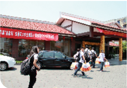
参赛选手抵达下榻宾馆