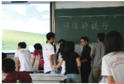
参赛选手在志愿者的指引下熟悉秘密答辩场地