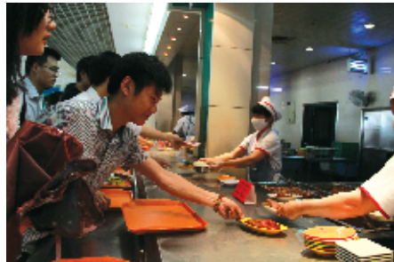
参赛选手在越秀校区美食城就餐