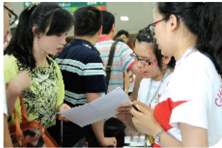
志愿者耐心解答参赛选手疑问