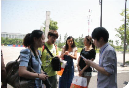
学生记者随机采访参赛选手