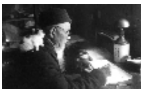
丰子恺于“日月楼”家中