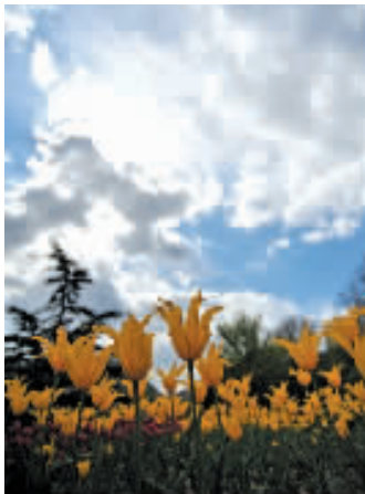
呼唤 张红光 摄影