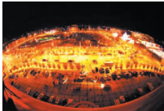
我的家乡