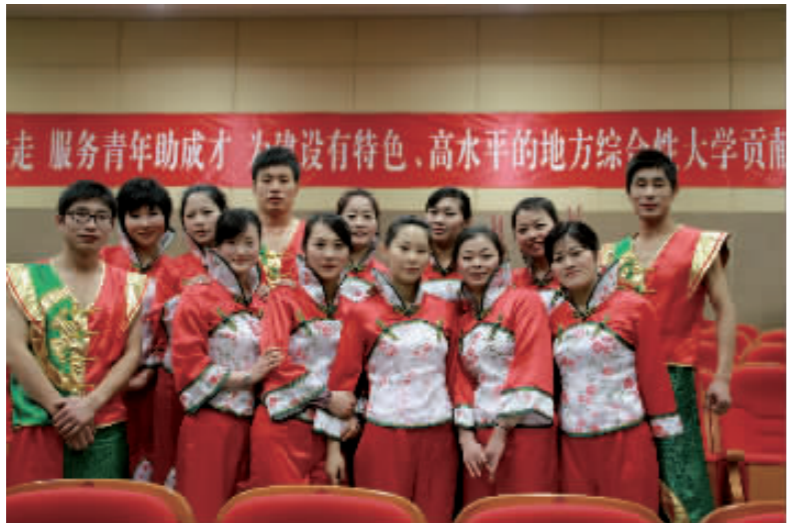
开场舞蹈《欢天喜地》