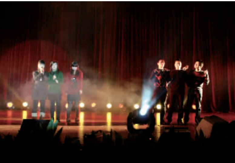
合唱《相亲相爱一家人》