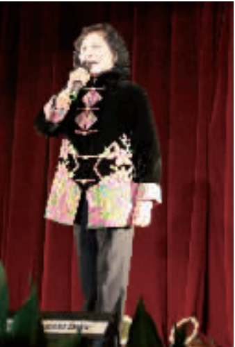
越剧选段《金玉良缘》