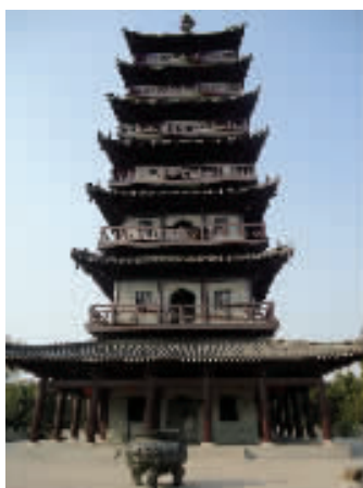
位于壕河边的壕股塔

突然想起《僧圆译传》中有这么一段话:“三生石上旧精魂,赏月吟风莫要论;惭愧情人远相访,此身虽异性长存。”壕股塔身异,壕股禅寺身异,但那积淀还在,释迦牟尼也好,伍子胥也好,都是文化符号,书写着嘉兴文化的之性。念珠也好,粽子也好,都化作茫茫碧海,衔接着远方的天空与山峦,创造着我们的历史。前世也好,今生也好,我不是我,我也是我,于历史的长河中,秉持着自我的真性。