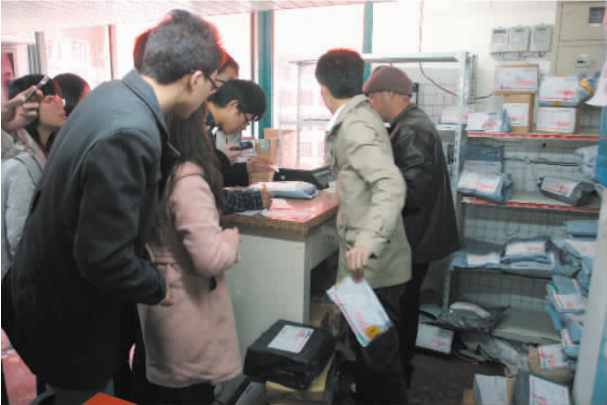
同学们在排队拿快递